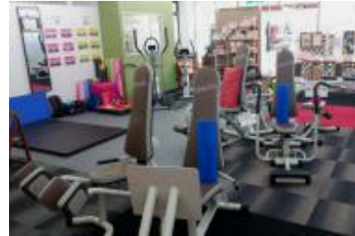
脂肪燃烧 ウォーキング&スロジョグマシン