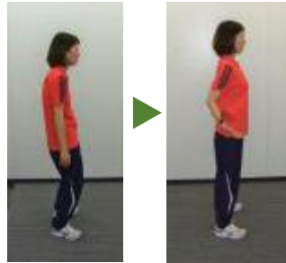
姿勢美人 肩甲骨を寄せるマシン