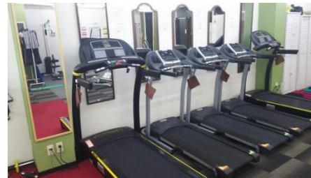
脂肪燃烧 ウォーキング&スロジョグマシン