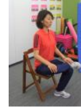
琉球温熱ドーム 冷え改善、免疫力UP