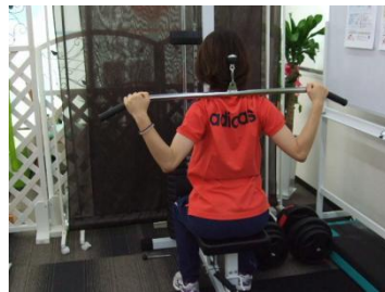
姿勢美人 肩甲骨を寄せるマシン